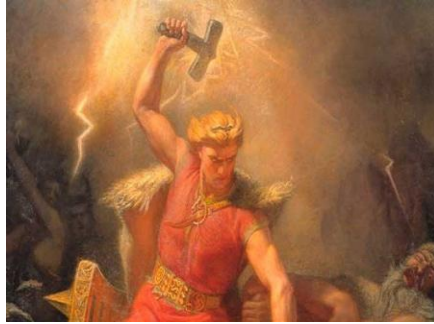
Imagen de Thor, dios del trueno en la mitología nórdica, que aparece mencionado en el libro.

Sofía comienza el Curso de Filosofía aunque, al Principio, desconoce la Identidad de su Profesor. La Primera Lección que recibe es sobre cómo Surgieron los Mitos. Los Primeros Humanos aludían a Ellos para Explicar los Fenómenos Naturales. Después, Aparecieron los Denominados como “Filósofos de Naturaleza”, que trataron de dar una Explicación sobre el Mundo y poner en Evidencia las Creencias Mitológicas Imperantes.