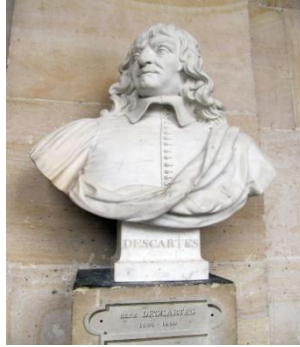
Busto de René Descartes

El Profesor pasa a Explicarle a Sofía las Figuras clave del Renacimiento y el Barroco. También, la Filosofía Dualista de Descartes y su Famosa Frase “ Pienso Luego Existo ”. Más tarde Continúa con la Filosofía de Spinoza, que Creyó que Dios había Creado las Leyes de la Naturaleza que Rigen lo que el Hombre Puede Hacer. Después, le Habla sobre Locke y su Teoría sobre la “ Tabula Rasa ”, también sobre David Hume y George Berkeley, que Pensó que los Humanos solo Existen en la Mente de un “ Dios Creador ”. Alberto le da a Entender a Sofía que son Personajes Ficticios de una Novela que Albert Knag ha Escrito para su hija Hilde.