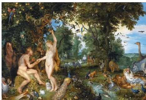
"El Jardín del Edén con la caída del hombre" de Peter Paul Rubens y Jan Brueghel el Viejo.

En este proceso de madurez, Sofía sigue acudiendo a un sitio donde puede conservar su Inocencia. Como un Niño que tiene un Escondite Secreto, la Joven accede a ese Lugar a través de un Seto al final del Jardín de su Casa. Para Sofía, ese "Callejón" es lo más Parecido al Paraíso, tal y como Ella imaginaba que sería el Jardín del Edén Descrito en el Génesis. Durante la Infancia, es muy Común que los Niños Vivan en un Mundo de Fantasía, que luego Pierden en la Etapa Adulta. Así, Podemos Entender el Jardín como un Lugar de Protección de la Niñez en el que Sofía puede Liberarse Presión que tiene para Crecer y Perder su Ingenuidad.