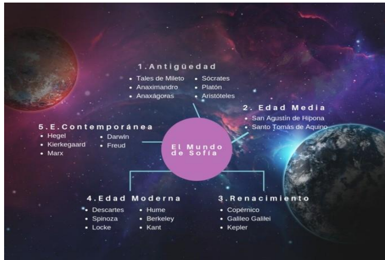
Esquema de los filósofos que aparecen en el libro.

A Continuación, se puede Observar un Esquema de los Filósofos que aparecen en El Mundo de Sofía .